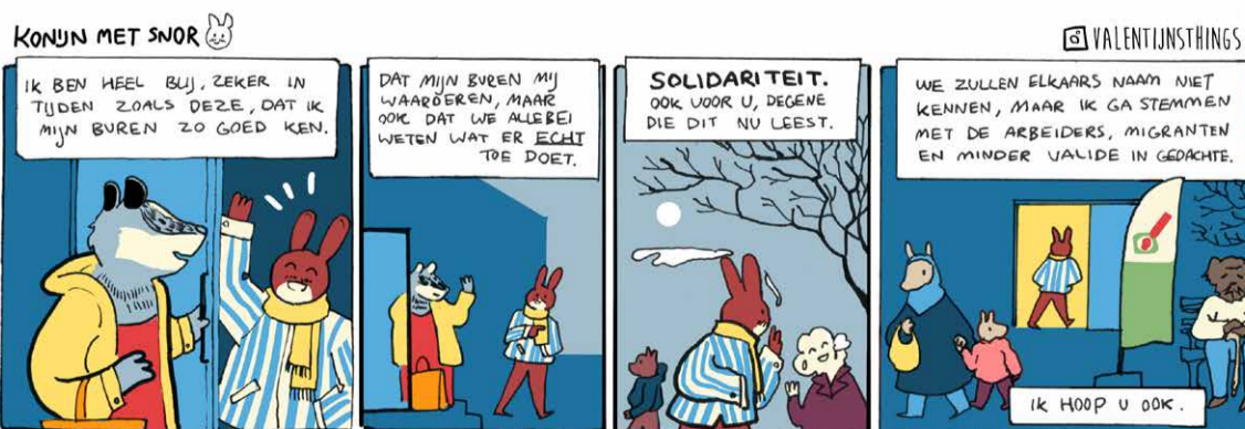
Door Valentijn Hamel

en ruil ze om voor iets nieuws. Of kom gewoon snuffelen tussen de kleding die er al hangt. Ook zit Nathalie bij de Inloop klaar met een naaimachine voor bijvoorbeeld een kleine reparatie. Je kan haar om hulp vragen of zelf achter de machine kruipen. Kom je ook?